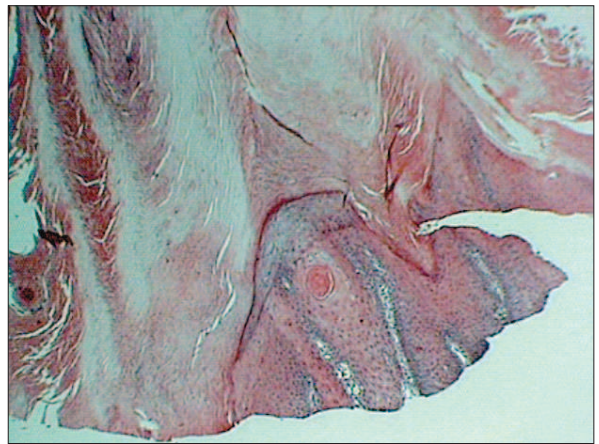
Fig. 2. Hex4 - Orto/parakeratoză dispusă columnar Fig. 2. Hex4 - Columnar ortho/parakeratosis