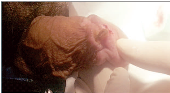
Fig. 1. Leziune tumorală, keratozică, foarte dură, cu baza de implantare mobilă, situată în șanțul balano-prepuțial Fig. 1. Hyperkeratotic, rough, tumoral lesion with mobile implantation base located in the balanopreputial sulcus

After wards we performed the electrocauterization of the remaining lesion followed by daily local application of antibiotic with a good local evolution. The HPV typing could not be performed although it would have been useful. At discharge we recommended the administration of Isoprinosin 10 days/month for 3 months.