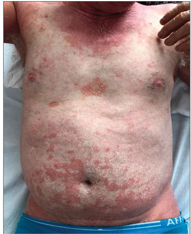
Figura 4 - Placarde eritemato-scuamoase, intricate cu zone de piele depigmentată (vitiligo); papule keratozice foliculare (cazul clinic 2)