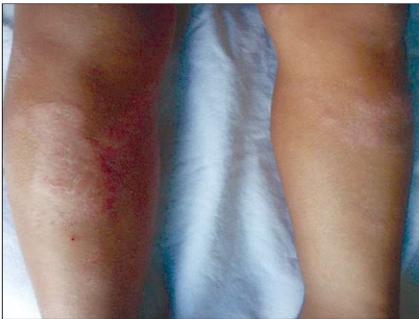
Figura 10 - Placarde rotund-ovalare, roșu-orange, scuamoase (cazul clinic 4)

Analize de laborator: Hemoleucogramă normală, examen de urină prezintă frecvente leucocite, rară floră, ASLO crescut (400 UI/ml), exudat faringian normal, iar urocultura a fost negativă. A fost exclusă infecția HIV în urma efectuării testelor specifice.