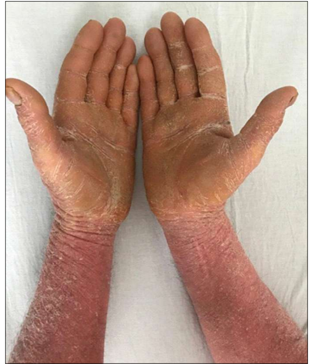
Figura 6 - Hiperkeratoză xantocromă palmo-plantară (cazul clinic 2) Figure 6 - Palmo-plantar xanthochromic hyperkeratosis (clinical case 2)