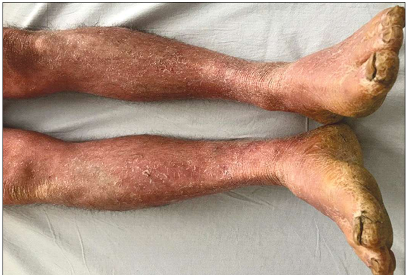
Figura 7 - Unghii îngroșate, mate, cu hipercheratoza patului unghial (cazul clinic 2) Figure 7 - Thickened, matted nails with hyperkeratosis of the nail bed (case 2)

nistrarea orală a unui AINS, ulterior extinzându-se la nivelul întregului corp.