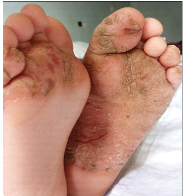
Figure 12 - Erythematous, hyperkeratotic plaques with crusts and painful fissures at plantar level (clinical case 4)

Pentru examenul histopatologic am recoltat două fragmente cutanate, unul de la nivelul regiunii interfesiere, celălalt de la nivelul plantei stângi, evidențiind epiderm cu acantoză moderată, orto-parakeratoză și discretă spongioză, în dermul papilar infiltrat inflamator cronic perivascular și perifolicular; pentru al II-lea fragment cutanat aspectul microscopic a fost: epiderm cu zonă întinsă de parakeratoză, hipogranuloză, spongioză moderată, iar în dermul papilar infiltrat inflamator cronic.