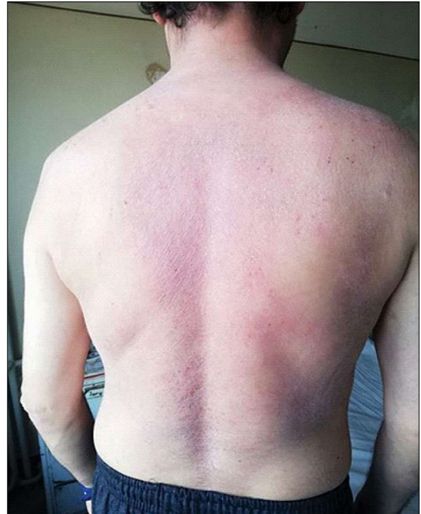
Figura 2 - Eruupție eritemato-scuamoasă (cazul clinic 1) Figure 2 - Erythematous-scaly eruption (clinical case 1)

Colecistectomie. Restul aparatelor în limite normale.