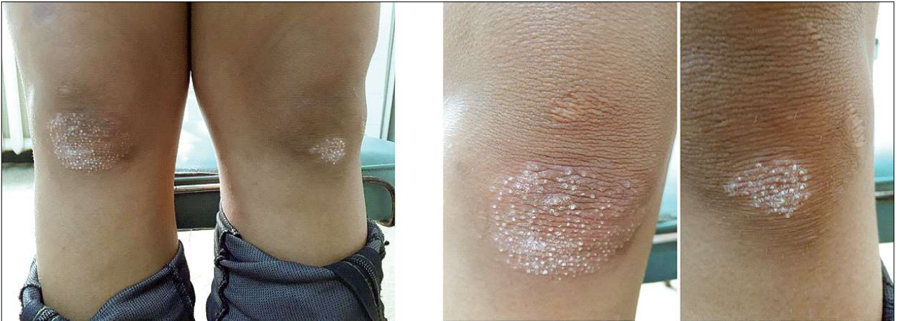
Figura 8- Placarde foliculare keratozice circumscrie (cazul clinic 3) Figure 8 - Circumscribed keratotic follicular plaques (clinical case 3)

Exudat faringian: streptococ beta-hemolitic prezent.