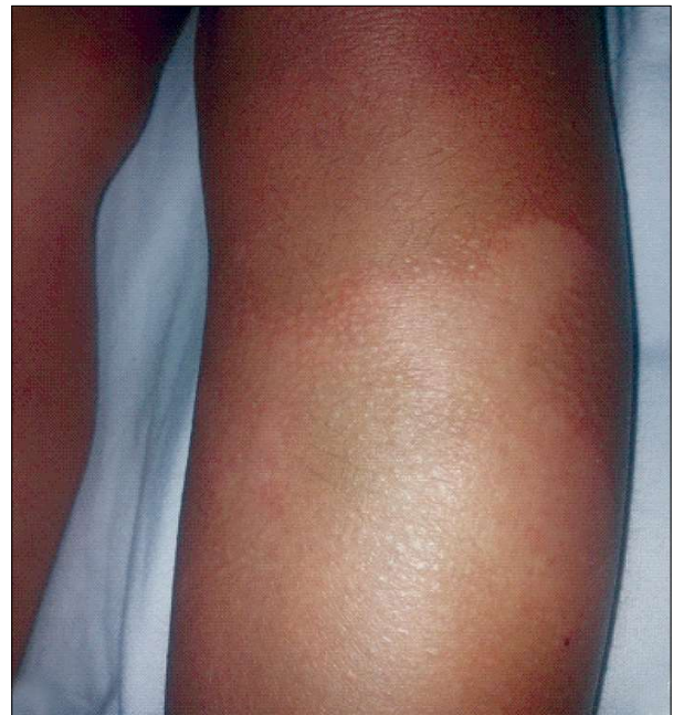
Figura 11 - Placard rotund-ovalar, roșu-orange, scuamos și papule foliculare keratozice (cazul clinic 4)

Laboratory analyses: Normal blood count, urine examination shows frequent leukocytes, rare flora, increased ASO titer (400 IU/ml), normal pharyngeal exudate, and the urine