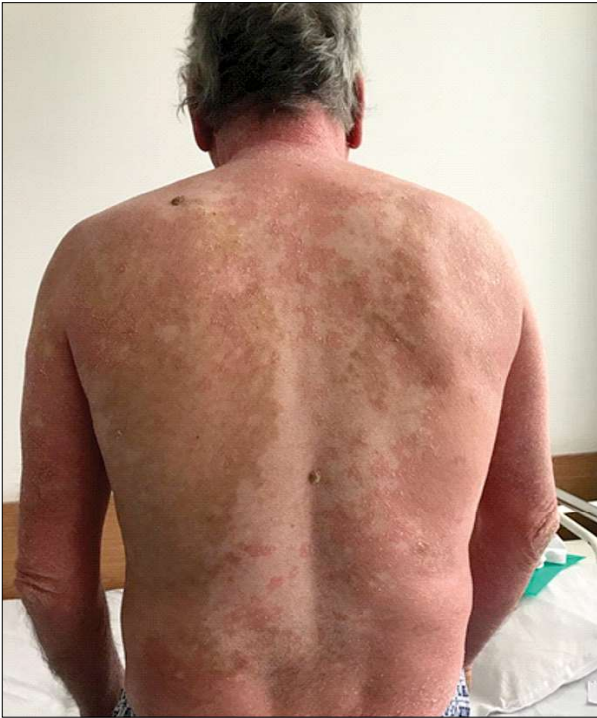
Figura 5 - Placarde eritemato-scuamoase, intricate cu zone de piele sănătoasă (cazul clinic 2) Figure 5 - Erythematous-scaly plaques, associated with areas of healthy skin (clinical case 2)