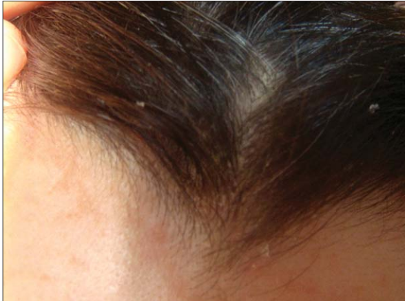
Fig. 1. Pacientă cu psoriazis al scalpului înainte de tratament.