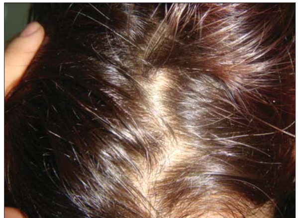
Figura 4. Pacienta cu psoriazis al scalpului după 8 săptămâni de tratament.