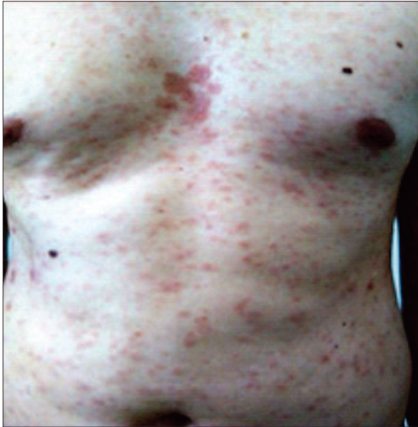
Figura 1. Sifilide psoriaziforme toraco-abdominal Figure 1. Psoriasis-like syphilides at thoracoabdominal level

Tratamentul sistemic cu Benzatin-penicilină 2,4mil/săptămână, 3 săptămâni a determinat remiterea sifilidelor, iar dermatocorticoizii și keratoliticele au ameliorat leziunile de psoriazis. Ulterior pacientul a fost monitorizat clinico-serologic conform protocolului Ministerului Sănătății (la fiecare 3 luni în primul an, apoi la 6 luni în al doilea an și anual în următorii 5 ani).