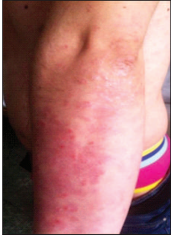
Figura 2. Aspectul clinic al leziunilor de psoriazis vulgar la internare Figure 2. Clinical aspect of psoriasis vulgaris upon admission

psoriasis vulgaris. Laboratory investigations revealed an inflammatory syndrome (C-Reactive Protein - CRP 19,32 mg/L, erythrocyte sedimentation rate (ESR) 19 mm/h), lymphocytosis (37,6%) with monocytosis (11,0%), positive serology for syphilis Treponema pallidum Haemagglutination Assay - TPHA positive at 1/2048 dilution, Venereal Disease Research Laboratory - VDRL positive at 1/64 dilution) and negative for HIV.