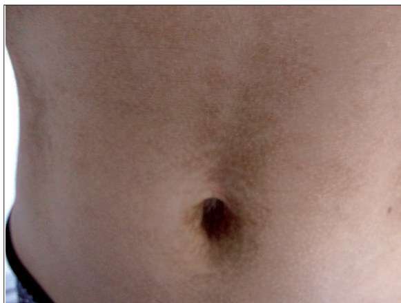
Fig. 2. Aspect clinic al dermatozei terra firma-forme localizată la nivelul regiunii periombilicale la o pacientă de 10 ani Fig. 2. Clinical aspect of Terra Firma-Forme dermatosis on the periumbilical region of a 10 years-old girl

Mycobacterial examinations were negative. Pigmentation persists despite the sometimes-insistent washing with water and soap. Instead, the vigorous friction of these areas with a 70° alcohol-rich compression resulted in the disappearance of pigmentation and the appearance of healthy skin, the compression revealing a dirty appearance. The clinical aspect, the persistence of the pigmentation despite the washing with water