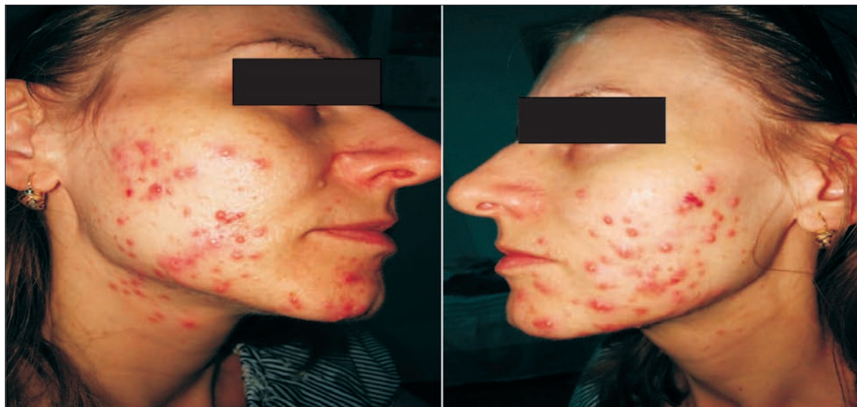
Figura 2. Leziuni papulo-pustuloase, rari noduli, cicatrice și pete pigmentare postinflamatorii. Figure 2. Before treatment. Papules and pustules, rare nodules, scars and post-inflammatory hyperpigmentation.

The patient was evaluated after each treatment session. There were two sessions per month, in total six treatment sessions. No notable adverse effects were observed (figure 3 and 4).