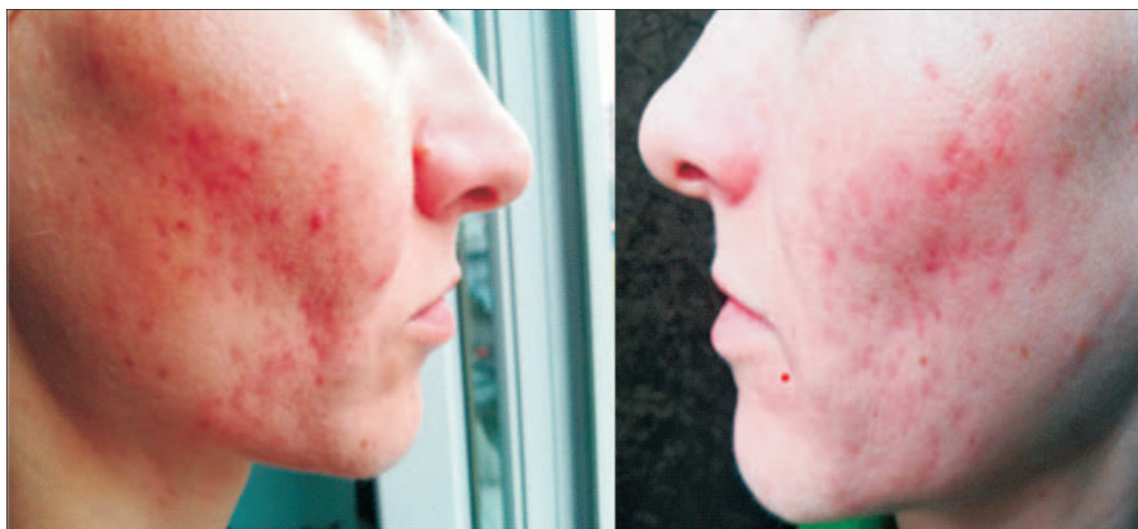
Figura 4. Pacienta după 6 ședințe de tratament. Figure 4. After six treatment sessions.