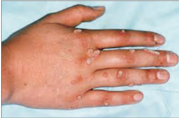
Fig 2. Veruci comune Fig 2. Common verrucae