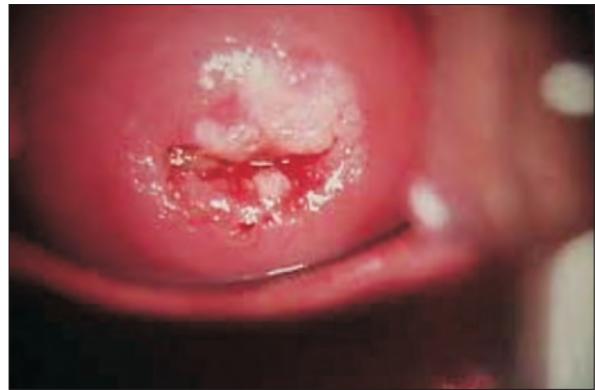
Fig 6. CIN III

Comportamentul sexual [1,8] – este cel mai important factor de risc; probabilitatea de a intra în contact cu HPV și în consecință de a se infecta crește direct proporțional cu numărul de