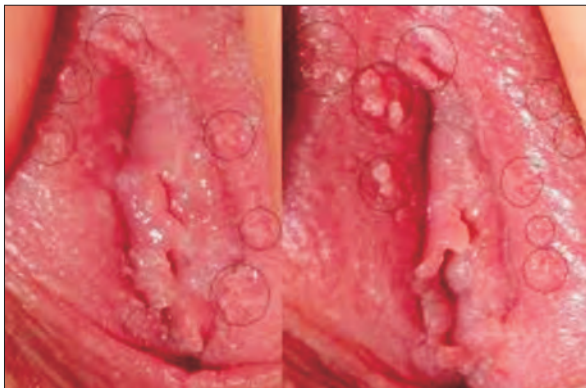
Fig 4. Condilomatoza vulvu-perineală Fig 4. Vulvoperinealcondilomatosis