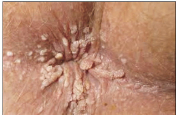
Fig 5. Condilomatoza vulvu-perineală Fig 5. Vulvoperinealcondilomatosis

1, 2, 4, 63 - negii plantari. Mici leziuni care apar pe tălpile picioarelor; arată de obicei ca o conopidă, cu hemoragii foarte mici (petesii), sub piele. Când sunt zgâriate ele pot sângera. Pacienții pot prezenta durere la mersul pe jos sau ortostatism prelungit. Ele pot fi similare bățăturilor sau calusurilor.