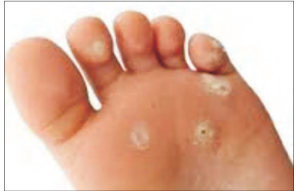
Fig 3. Veruci comune Fig 3. Common verrucae