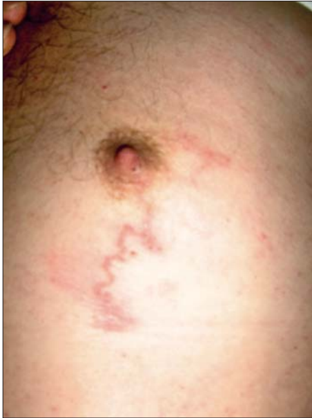
Figura 1. Erupecie liniară serpiginoasă cu lungimea de câțiva centimetri localizată pe toracele anterior (caz clinic 1)

Figure 1. Serpiginous linear eruption of several centimeters in length, localised on the front side of the thorax (clinical case no. 1).