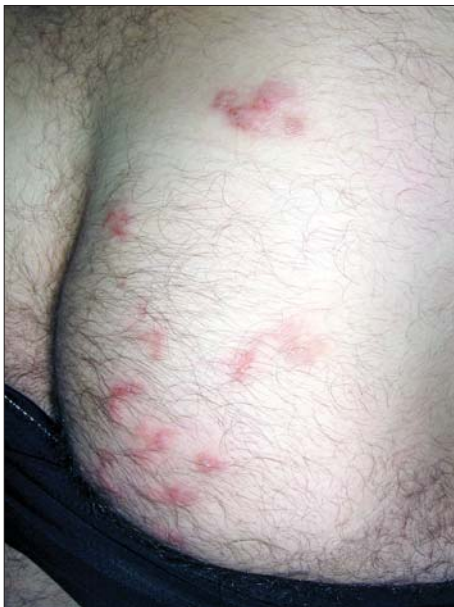
Figura 3. Placarde eczematiforme cu prezența și a câtorva leziuni liniare serpiginoase localizate pe fesa dreaptă (caz clinic 3)

Patient aged 51 was consulted for the appearance of a pruriginous eruption on the back about three weeks prior to examination. Patient had sunbathed on the bank of a river. Dermatological investigation has revealed a pruriginous eczematous eruption as well as serpiginous linear lesions on the upper side of the back (Fig. 4). Cutaneous larva migrans diagnosis was established by means of anamnesis and clinical examination. Treatment consisting in albendazole 400 mg daily for 5 days has led to complete eruption remission within days after treatment.