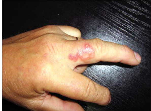
Figura 2. Traiect eritematos serpiginos cu pustule pe suprafață, cu lungimea de 4-5 cm, localizat pe fața laterală a degetului mediu al mâinii stângi (caz clinic 2)

Pacient în vârstă de 58 de ani a fost consultat pentru o erupție eczematiformă pruriginoasă localizată pe fese, apărută de aproximativ patru săptămâni. În perioada apariției erupției pacientul a lucrat în agricultură la strânsul fânului. Examenul dermatologic a evidențiat placarde eczematiforme pruriginoase cu prezența și a câtorva leziuni liniare serpiginoase localizate