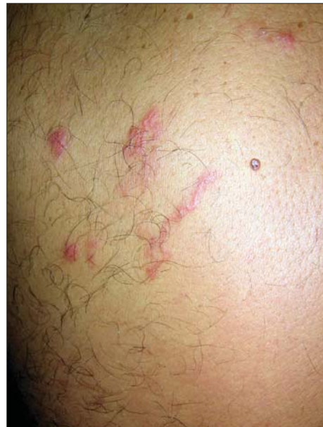
Figura 4. Eruptie eczematiformă și leziuni liniare serpiginoase localizate pe partea superioară a spatelui (caz clinic 4)

Figure 3. Eczema-like scales and serpiginous linear lesions localised on the right buttock (clinical case no. 3).