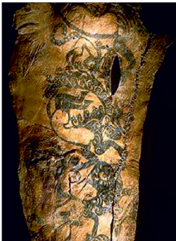
Figura 1: Tatuaj pe mâna stângă mumificată a unui șef de trib Scitian, c.500 î.Hr (Hermitage Museum, St Petersburg, Russia).