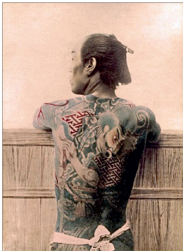
Figura 2: Fotografie realizată de Kusakabe Kimbei-“ Paysan Tatoue”, circa 1875.