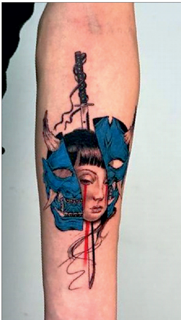
Figura 7: Tatuaj realizat prin tehnică mixtă, neojaponeza și hiperrealism alb-negru, reprezentând înfruntarea adevărului (Arhiva personală).