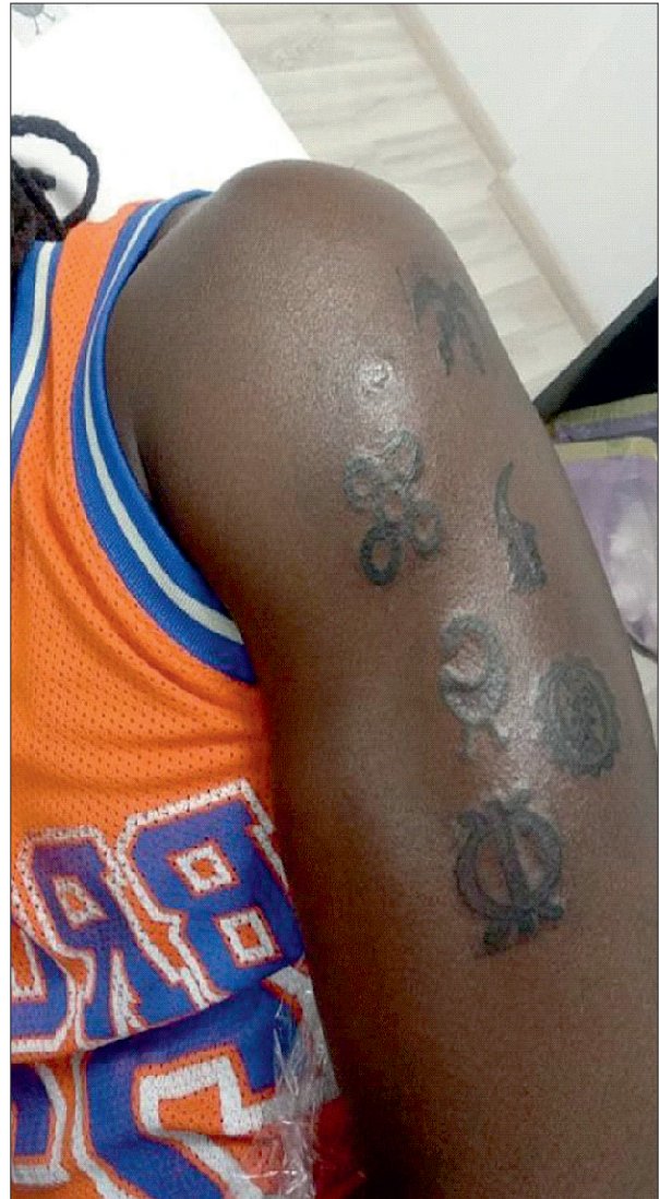
Figura 6: Tatuaj cu simboluri ghaneze numite Adinkra, ce reprezintă și individuale precum curajul, loialitatea, perseverența (Arhivă personală).

Actualmente există o tendință către modificarea percepției generale asupra tatuajelor și abandonarea stigmatelor ce asociază tatuajele cu instabilitatea emoțională sau cu infracționalitatea. Persoanele din Occident aleg diverse modele de tatuaje, de la simple simboluri sau