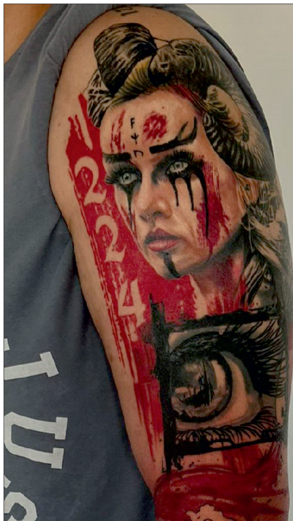
Figura 8: Tatuaj complex realizat prin suprarealism color, ce reprezintă simboluri și zeități nordice