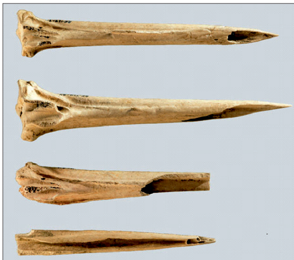
Figura 3: Două fragmente osoase provenind de la un curcan, cu vârfuri ascuțite (sus), cele mai vechi instrumente de tatuat descoperite. Alte două fragmente osoase provenind de la un curcan (jos), găsite în același sit istoric, cărora le lipsește vârful.

Din punct de vedere istoric, tehnicile și instrumentele folosite pentru tatuare au evoluat considerabil de-a lungul timpului. În trecut, tatuajele erau aplicate folosind instrumente primitive, cum ar fi bețe sau fragmente osoase ascuțite (Fig. 3), care erau înfipte în piele pentru a introduce cerneală sau pigment. Aceste instrumente au variat în funcție de cultura și regiunea geografică. Există dovezi istorice ce indică materiale precum lemn, sticlă, fildeș, metal (Fig. 4) Pentru a crea tatuaje, se foloseau diferite substanțe pentru pigmentare. Acestea variau de la cărbune la anumite tipuri de argilă colorată. Tehnica implica lovirea unui instrument ascuțit încărcat cu pigment în piele cu ajutorul unui