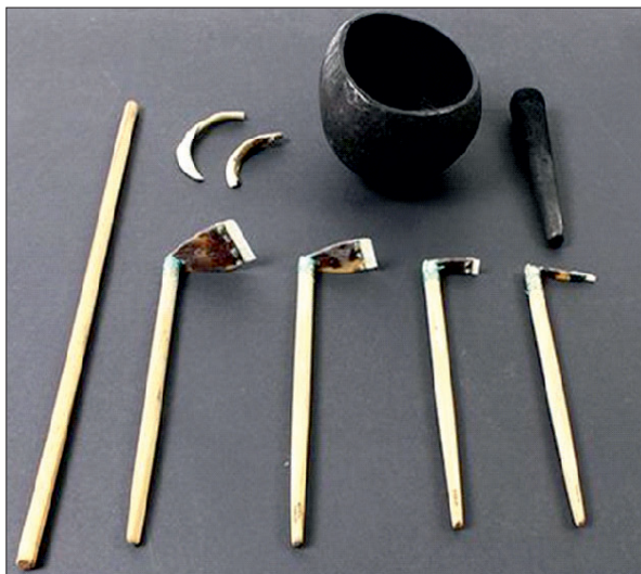
Figura 4: Set de unelte și instrumente folosite pentru tătatau, făcute de Tufuga tătatau Su'a Sulu'ape Paulo II. Su'a Sulu'ape Paulo II, 1991. (Muzeul Memorial al Războiului, Auckland, Noua Zeelandă).

Historically, the techniques and tools used for tattooing have evolved considerably over time. In the past, tattoos were applied using primitive tools, such as sticks or sharp bone fragments (Fig.3), which were stuck into the skin to insert ink or pigment. These tools varied according to culture and geographic region. There is historical evidence indicating materials such as wood, glass, ivory, metal (fig. 4) To create tattoos, different substances were used for pigmentation. They ranged from coal to certain types of colored clay. The technique involves striking a sharp